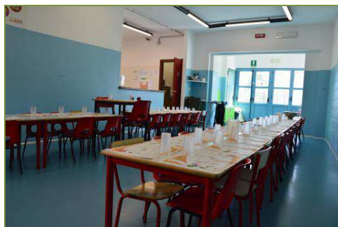
Mensa Scuola Infanzia Morante