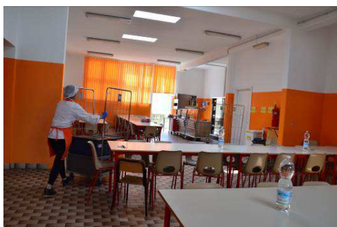
Mensa scuola Secondaria Montalcini