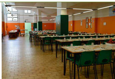
Mensa scuola primaria Collodi